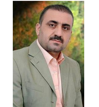
نهمیر نهمه‌د عه‌بدولقادر سه‌رچاوه: پینووسه‌کان

لیالی نه‌و واقعیه‌ی سیسته‌می په‌روه‌ده‌ی گرتوته‌وه به‌شیکي گه‌وره‌ی تاوان له‌نه‌ستوی نه‌و دوو دامه‌زراوه‌ بالاییه‌به. به‌ره‌مه‌ی نه‌و هه‌موو (قبول خاص) و ده‌ستیوه‌ردانه‌ حیزبیه‌ی سالانی رابردوو، لاوازکردنی توانا زانستی و نه‌کادیمیه‌کان، که‌چی نه‌و هه‌موو بروانامه (پله‌ نایاب)ه ناوه‌روک لاوازانه بوو به‌م روژیه‌ان گه‌یاندین. زه‌مه‌نی زوری ده‌وی هه‌تا پرؤسه‌ی په‌روه‌ده‌و فیرکردن ئیفلیج ده‌کری، زور له‌وه زیاتر ده‌وی هه‌تا جاریکی تر له‌به‌ر نه‌نجامی گرتنه‌ی به‌ری رفیژرمی به‌رده‌وام زیندوو ده‌کریته‌وه. هاتنه به‌ره‌می بیروکی ناته‌ندروست له‌په‌رؤسه‌ی په‌روه‌ده‌و فیرکردن وه‌کو داچاندنی داری گویز وایه، نه‌م نه‌وه‌یه هه‌نگاوی بؤ هه‌ل‌ده‌گری و نه‌وه‌ی دواتر به‌ره‌مه‌که‌ی ده‌چینه‌تو، له‌هه‌ریمی کوردستاندا، نه‌وه‌یه‌ک ئیفلیجی کرد، نه‌وه‌ی دوی خوی باجه‌کی ده‌دا!!